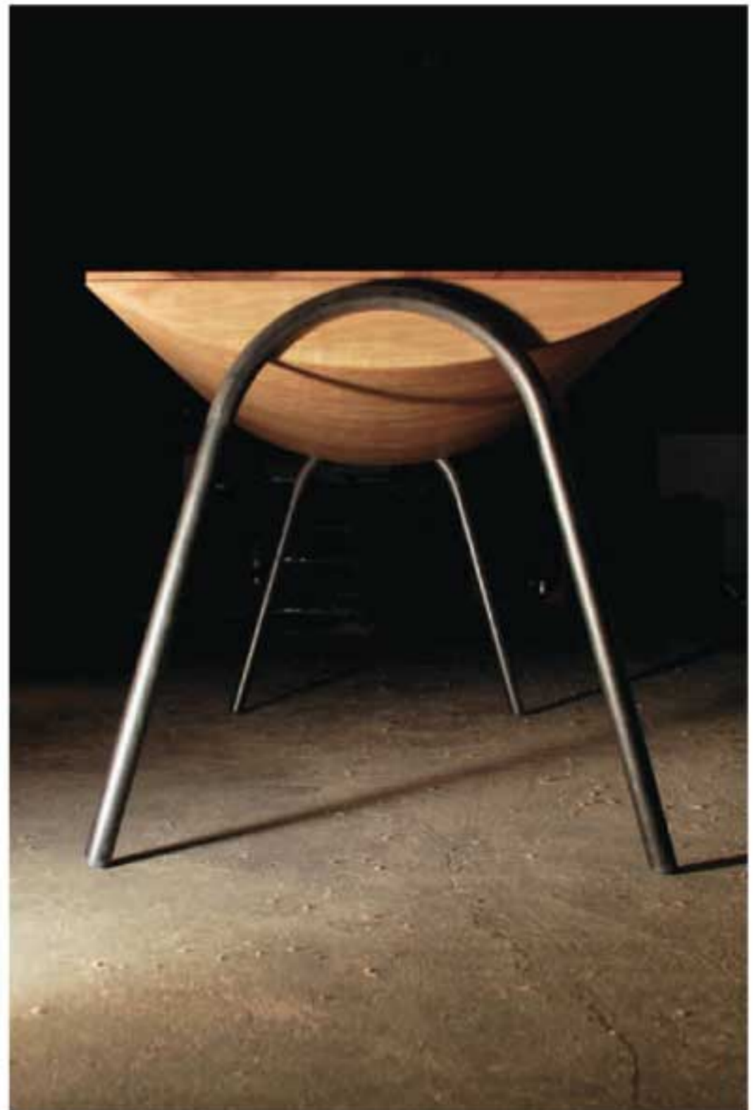
Corpus mit Innenleben (Nussbaum massiv, Beine: Stahl roh).